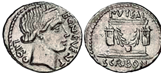
Fig. 18. Denario RRC 416/1c (ampliado x 2).

Las monedas de Libón proporcionan la evidencia más antigua existente de la presencia del Puteal y la única evidencia visual de su apariencia física, al menos como se veía a finales de la década de los años 60s a.C. (KONDRATIEFF 2015: 430).