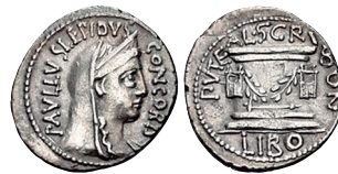
Fig. 20. RRC 417/1a. AR. Denario.

La descripción de esta amonedación es la siguiente según M. H. Crawford (1974: 442):