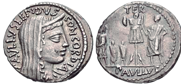
Fig. 6. Denario RRC 415/1 (ampliado x 2).

El magistrado monetar es L. Emilio Lépido Paulo ( cos. 50 a.C.) (4) , hermano mayor del triunviro M. Emilio Lépido ( cos. I 46 a.C.), no P. Emilio Lépido ( cos. suff. 34 a.C.), su hijo, como se ha defendido anteriormente (5) . Su relación con L. Emilio Paulo ( cos. I 182 a.C.) (CRAWFORD 1974: 441; HARLAN 1995: 3), a quien se homenajea en esta acuñación, se destaca mediante el uso del agnomen como praenomen (6) . Las fuentes literarias ofrecen ejemplos sobre la arrogación de nombres altisonantes (Cic. Brut. 62; Fam. 15, 20, 1. Plin. NH 35, 8) (CRAWFORD 1974: 441).