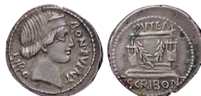
Fig. 14. RRC 416/1b. AR. Denario.

Se ha señalado la existencia de una variante con la leyenda SCARIBON (FERNÁNDEZ, FERNÁNDEZ Y CALICÓ 2002: 148 n° 1103).