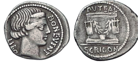
Fig. 15. RRC 416/1c. AR. Denario.