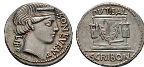
Fig. 13. RRC 416/1a. AR. Denario.

La descripción de esta amonedación es la siguiente según M. H. Crawford (1974: 441):