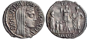
Fig. 5. Denario RRC 415/1 con leyenda PAVLVS en el reverso.

El magistrado monetar es L. Emilio Lépido Paulo ( cos. 50 a.C.) (4) , hermano mayor del triunviro M. Emilio Lépido ( cos. I 46 a.C.), no P. Emilio Lépido ( cos. suff. 34 a.C.), su hijo, como se ha defendido anteriormente (5) . Su relación con L. Emilio Paulo ( cos. I 182 a.C.) (CRAWFORD 1974: 441; HARLAN 1995: 3), a quien se homenajea en esta acuñación, se destaca mediante el uso del agnomen como praenomen (6) . Las fuentes literarias ofrecen ejemplos sobre la arrogación de nombres altisonantes (Cic. Brut. 62; Fam. 15, 20, 1. Plin. NH 35, 8) (CRAWFORD 1974: 441).