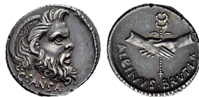
Fig. 24. Denario RRC 451/1 .

Se puede paralelizar esta serie con la del denario RRC 451/1 , emitido en la ciudad de Roma durante el año 48 a.C. Se trata de una combinación del anverso de RRC 449/1 y del reverso de RRC 450/2 , con variaciones menores (GRUEBER 1910: 502 n. 1; CRAWFORD 1974: 467; SEAR 1998: 19; CATALI 2001: 244; ALBERT 2011: 197). Podría parecer un híbrido de las dos emisiones anteriores, pero la diferencia de leyenda del anverso de esta acuñación con respecto a la de los denarios RRC 449/1-3 muestra que no lo es (GRUEBER 1910: 502 n. 1; SEAR 1998: 19; SYDENHAM 1952: 158). El número de cuños parece descartar así mismo que se tratara de un error de la ceca (AMELA 2020: 90), como en la amonedación RRC 417/1 .