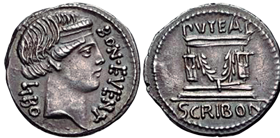
Fig. 16. Denario RRC 416/1a (ampliado x 2).

El magistrado monetaral pudiera tratarse de L. Escribonio Libón ( cos. 34 a.C.) (13) , pero entonces debería tener una edad avanzada, por lo que quizás más bien se trataría de su padre, atestiguado en AE 1892 73 = CIL VI 31276 = ILLRP 411 = ILS 8892 y quizás también en CIL I 2 1744 = CIL IX 2171-2172 y CIL I 2 1745 = CIL IX 2174 (DEGRASSI 1962: 74; CRAWFORD 1974: 442; FRIER 1983: 223, 1985: n. 55; CARUSO: 1990: 9; GÜNTHER 2016: 30). Pero esta primera inscripción pertenece al futuro cónsul (CARUSO 1999: 10), aunque parece más posible su mención en los otros dos epígrafes. M.-C. Ferriès (2007: 462) no incluye la magistratura monetaral en la carrera del futuro cónsul.