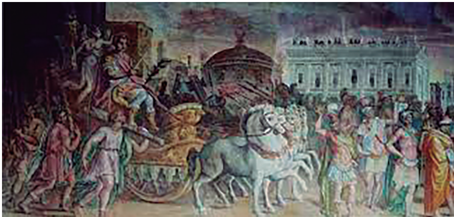
Fig. 8. Triunfo de Lucio Emilio Paulo sobre Perseo, fresco de Michele Alberti y Jacopo Rochetti (1569).