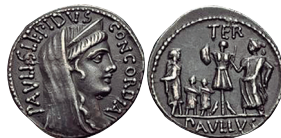
Fig. 4. Denario RRC 415/1 con leyenda PAVLLS en el anverso.