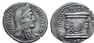
Fig. 21. RRC 417/1b. AR. Denario.

Rev.: Puteal Scribonianum, decorado con guirnalda y dos lirras; en la base, martillo; encima, PVTEAL•SCRIBON; debajo, LIBO. Grafila de puntos.