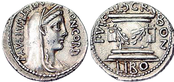
Fig. 22. Denario RRC 417/1a (ampliado x 2).

Como se puede apreciar, la tipología de esta emisión es una combinación del anverso de la acuñación RRC 415 de Paulo Lépidio y el reverso del de RRC 416 de Libón, con variaciones menores (en las leyendas) 8 GRUEBER 1910: 420 n. 1; CRAWFORD 1974: 442; HOLLSTEIN 1993: 216). Es decir, una amonedación híbrida oficial (PASSHEL 2020: s.p.).