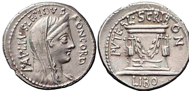
Fig. 23. Denario RRC 417/1b (ampliado x 2).