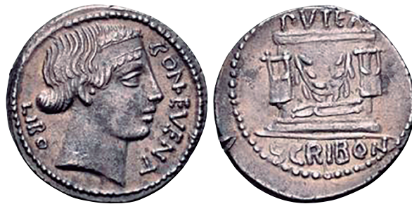
Fig. 17. Denario RRC 416/1b (ampliado x 2).

Su conexión con la gens Scribonia no ha sido explicada satisfactoriamente, pero H. Cohen y E. Babelon sugirieron en su día que Bonus Eventus puede ser una alusión a Beneventum (act. Benevento), de donde pudo haber venido originalmente la gens Scribonia , ya que las inscripciones relacionadas con ella sólo se han encontrado allí (COHEN 1857: 288; BABELON 1886: 427; ZEHACKER 1974: 497). Esta interpretación ya fue señalada por H. A. Grueber como un tanto conjetural (GRUEBER 1910: 419 n. 2).