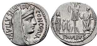
Fig. 3. Denario RRC 415/1 con leyenda CONCORIA en el anverso.