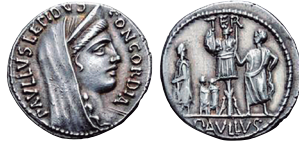
Fig. 2. - RRC 415/1. AR. Denario.

La descripción de esta amonedación es la siguiente según M. H. Crawford (1974: 441):