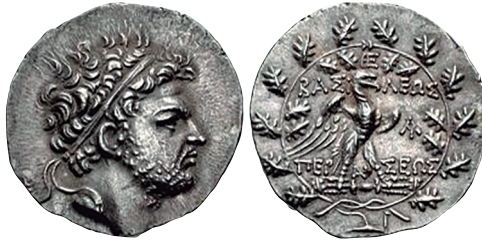
Fig. 7. Tetradracma de Perseo de Macedonia (HGC 3 1094 = Mamroth 26).

2012: 265; HAYMANN, 2013, 159). Cultivar la memoria de los miembros de las diferentes familias de los magistrados monetales a través de la descripción de sus éxitos militares fue una práctica popular durante el siglo I a.C. (Jarych 2021: 63).